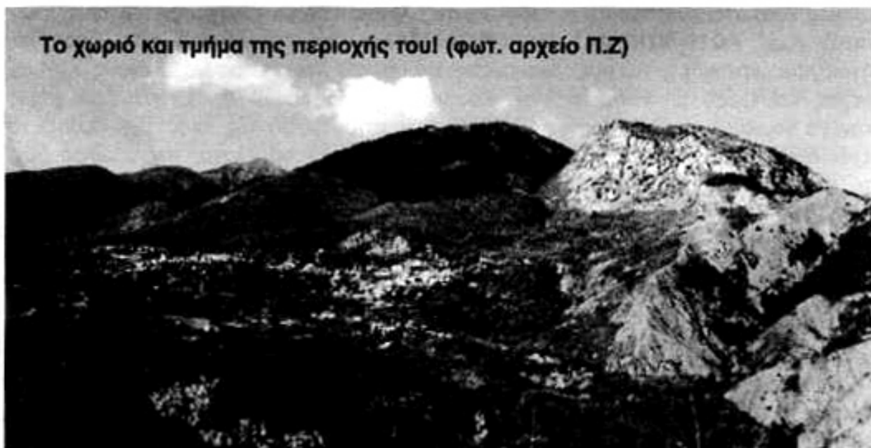
Το χωριό και τμήμα της περιοχής του!